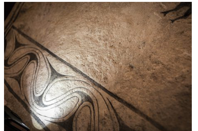
Imållningarna på bildstenarna, ofta gjorda av Sune Lindquist, är personliga tolkningar.