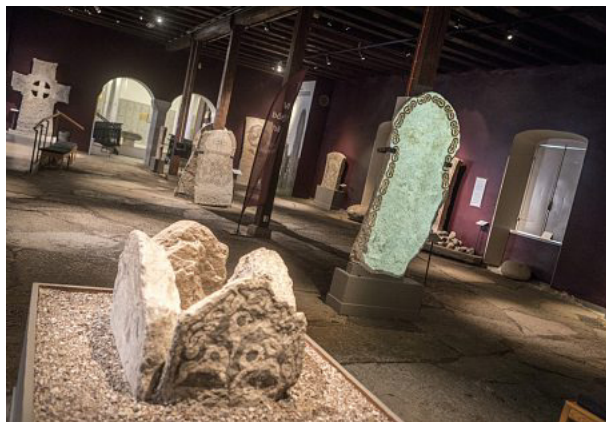
Presentationen av bildstenarna i Fornsalen lär komma att påverkas av digitaliseringsprojektet.